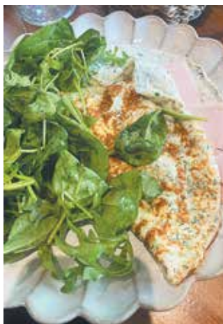
► Ομελέτα με λαχανικά στο «House of NYNN» του «The Ilisian»