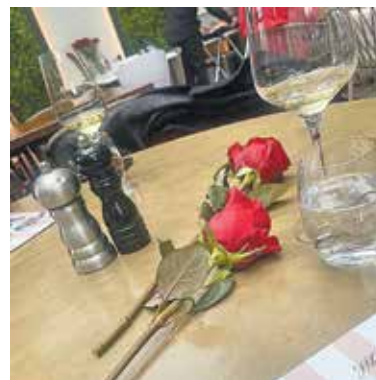
► Lunch την Πρωτομαγιά. Δύο κόκκινα τριαντάφυλλα στο τραπέζι του ψαροφαγικού resto «Ασπρόψαρο» στο Νέο Ηράκλειο