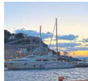
► Κινηματογραφικό σκηνικό στην Υδρα το τριήμερο με γκρίζο ουρανό, μουντά χρώματα και τα σκάφη να κουνιούνται... επικίνδυνα στο λιμάνι