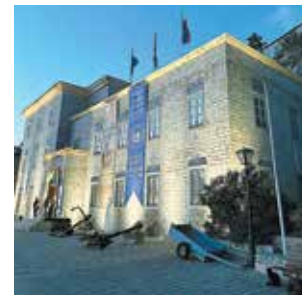
► Το εντυπωσιακό κτίριο του Ιστορικού Αρχείου Υδρας