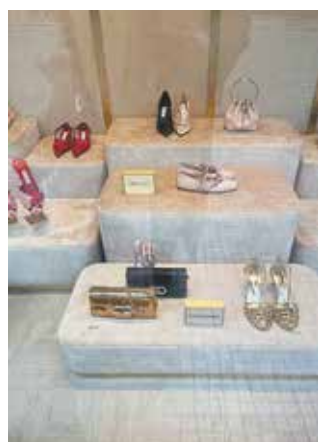
► Χρυσό και κόκκινο στα καλοκαιρινά παπούτσια της Καλογήρου στην Πλατεία Κολωνακίου