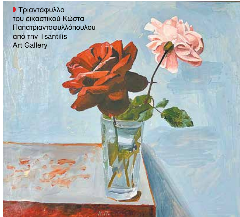
► Τριαντάφυλλα του εικαστικού Κώστα Παπατριανταφυλλόπουλου από την Tsantilis Art Gallery

λίγο κόσμο. Κάποιοι φίλοι επέλεξαν την κοσμοπολίτικη Γενεύη. Η πιο chic ελβετική πόλη φιλοξένησε αρκετούς Έλληνες που απόλαυσαν τις βόλτες τους εκεί. Πολύς κόσμος που αγαπάει το καλό ψάρι επισκέφθηκε το δημοφιλές «Αφρόψαρο» στο Νέο Ηράκλειο. Και του χρόνου!