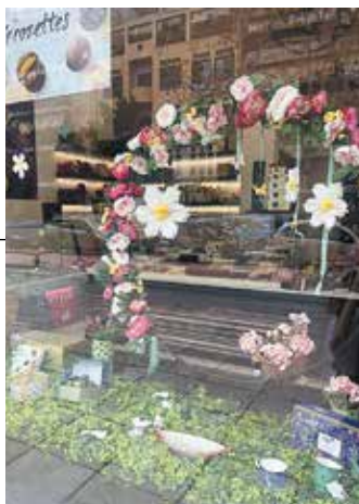
► Λουλούδια της άνοιξης και υπέροχα σοκολατάκια στον διεθνή «Leonidas». Με έμφαση στην white chocolate!