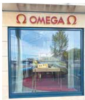
► Κατάστημα της ωρολογοποιίας OMEGA στη Γενεύη, πόλη των ρολογιών, των τραpezών και της κορυφαίας σοκολάτας