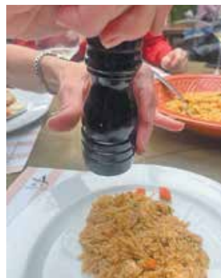
► Ρύζι με γαρίδες στο «Ασπρόψαρο»